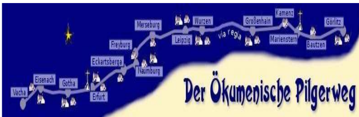
Rys. 4. Trasa Ekumenicznej Drogi Pątniczej na terenie wschodnich landów niemieckich dochodząca do granicy polsko-niemieckiej. Na podstawie: http://www.oekumenischer-pilgerweg.de/ .

Realizowane od 1989 r. projekty we Francji i Niemczech, od Pirenejów do Odry, zaowocowały pojawieniem się sieci uczęszczanych szlaków św. Jakuba w Europie [rys.3]. W latach 2002-2003 we wschodnich krajach związkowych Niemiec (Saksonia, Saksonia-Anhalt, Turyngia) przygotowano projekt reaktywowania szlaku św. Jakuba wzdłuż dawnej Via Regia . W realizacji projektu udział brały stowarzyszenia świeckie i religijne, samorządy lokalne i instytucje regionalne. Projekt otrzymał nazwę „Jakobusinitiative”, a wytyczona droga – Ekumeniczna Droga Pątnicza [rys 4].