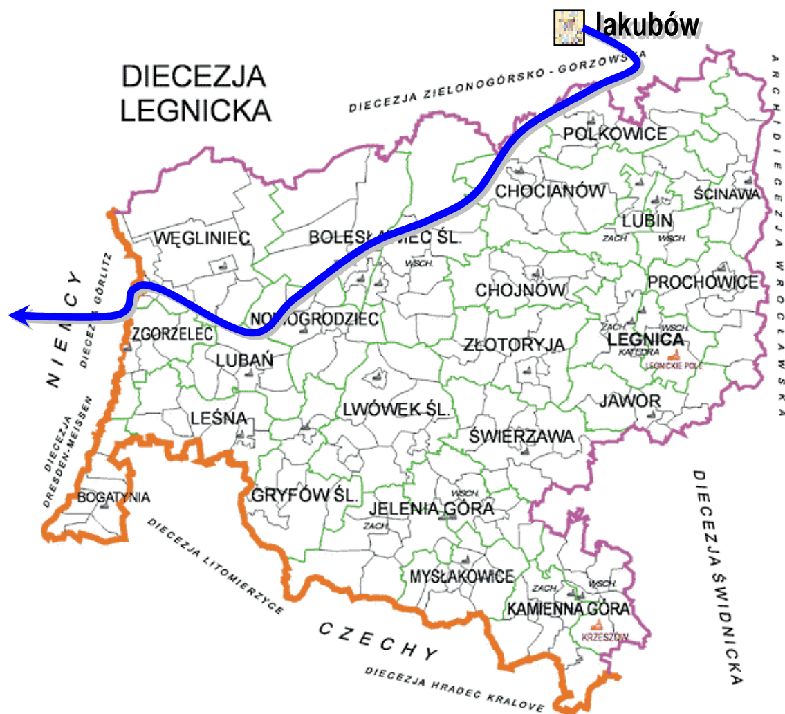
Rys. 5. Projektowana trasa szlaku na Dolnym Śląsku z Jakubowa do Zgorzelca. Mapa diecezji na podstawie strony internetowej diecezji Legnickiej.

Przyjęto również założenie, że do przebiegu trasy pielgrzymkowej włączony będzie Głogów. Motywowano to głównie argumentami odwołującymi się do historycznych związków tego miasta z Jakubowem (należał on do Kolegiaty Głogowskiej). Cała trasa od Głogowa do Zgorzelca ma być przygotowana zarówno dla pielgrzymów pieszych, jak i rowerowych. W przyszłości obejmie także pielgrzymów konnych. Część trasy przebiegać będzie wzdłuż istniejących i wytyczonych tras rowerowych i pieszych. Cała długość szlaku wyniesie ok. 165 km [rys. 5] i łączyć się będzie z niemieckim szlakiem św. Jakuba (Oekumenischer Pilgerweg) na Moście Staromiejskim łączącym Zgorzelec i Goerlitz. W roku 2005 ma powstać przewodnik po szlaku oraz opracowana i przygotowana baza noclegowa dla pielgrzymów. Bractwo nawiązało kontakt z innymi, podobnymi stowarzyszeniami w Europie.