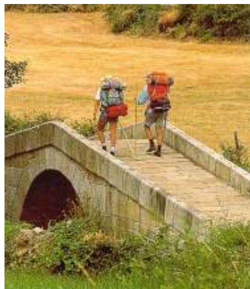
Rys. 2. Pielgrzymi średniowieczni i współcześni na szlaku pątniczym do św. Jakuba z Composteli. Na podstawie: http://www.josef-haag.homepage.t-online.de/index.htm .